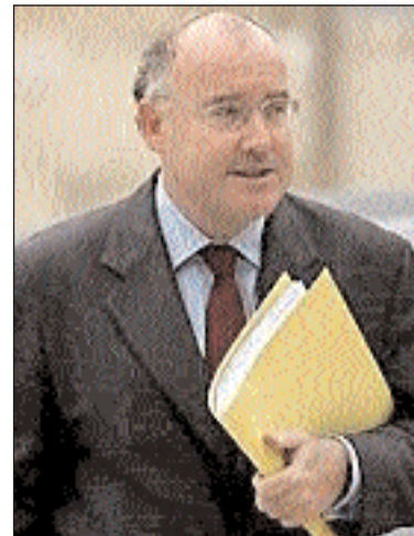
Le Ministre de l'Agriculture Dominique Bussereau a entamé la discussion sur le projet de loi d'orientation agricole devant l'Assemblée nationale le 5 octobre dernier.