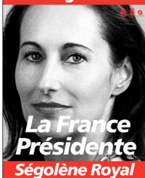
L'affiche officielle de la campagne de Ségolène Royal destinée à être collée sur les panneaux disposés spécialement dans chaque commune du département.

nationale permet également de se tenir informé au quotidien sur les temps forts de la campagne.